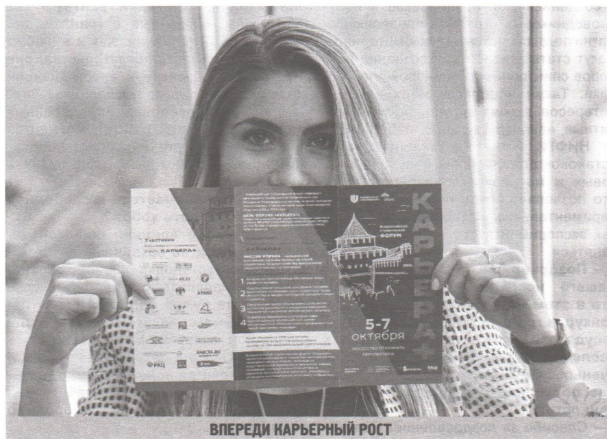
ВПЕРЕДИ КАРЬЕРНЫЙ РОСТ